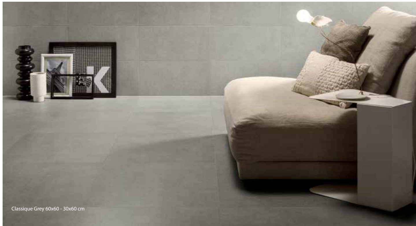
Classique Grey 60x60 - 30x60 cm