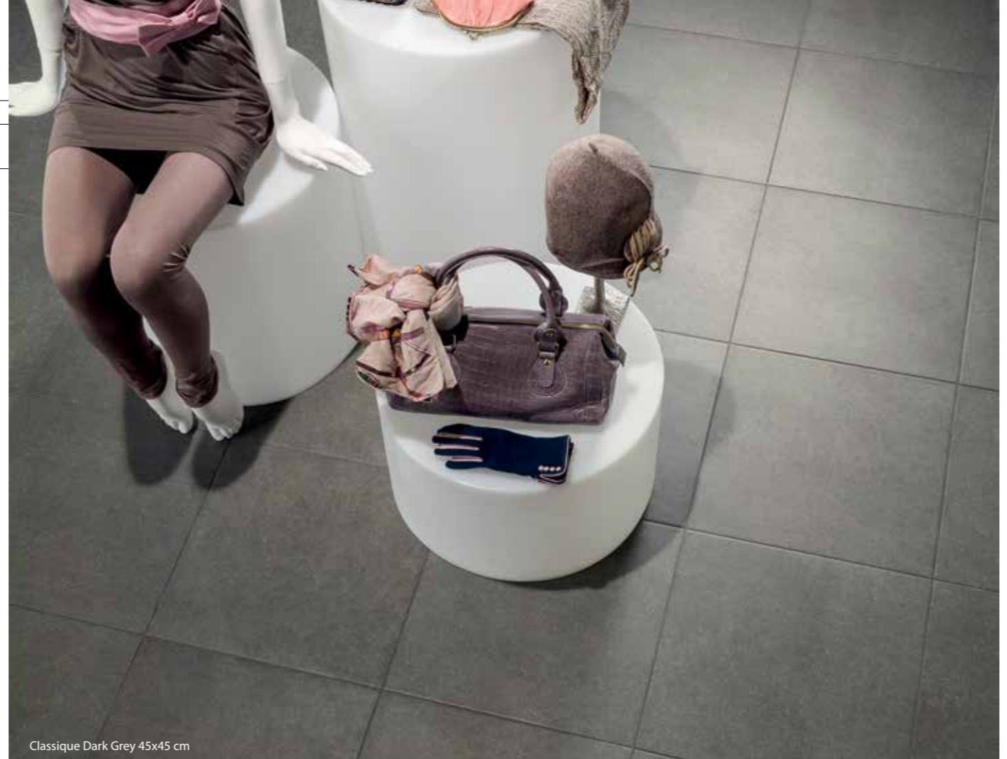
Classique Dark Grey 45x45 cm

** MONOCALIBRO, RETTIFICATO E SQUADRATO - RECTIFIED, SQUARED, ONE CALIBER - MONOCALIBRE, RECTIFIÉ ET MIS D'EQUERRE - EIN KALIBER, REKTIFIZIERT UND RECHTWINKELIG