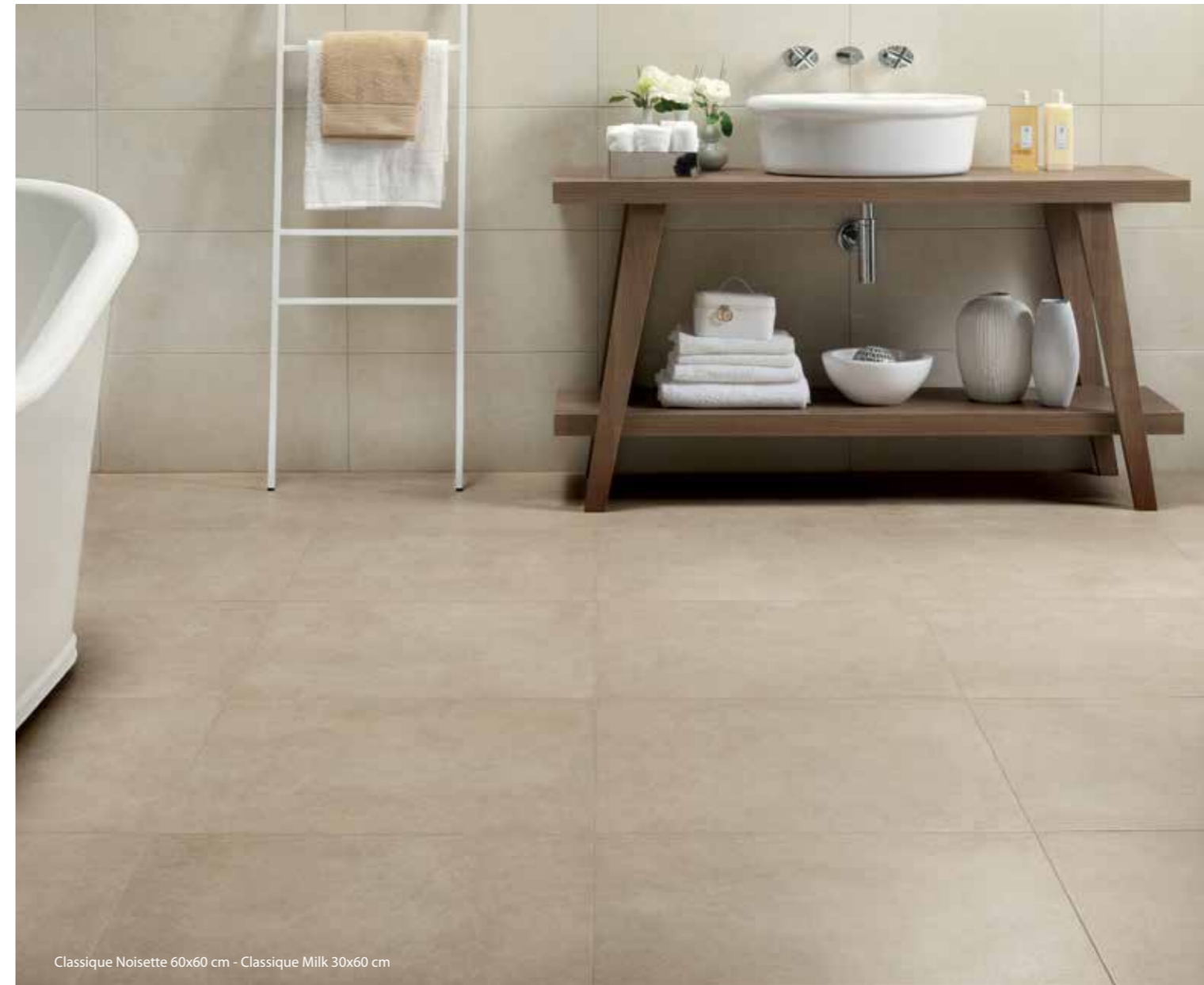
Classique Noisette 60x60 cm - Classique Milk 30x60 cm

60x60 cm - 23 5/8" x 23 5/8" • 30x60 cm - 11 13/16" x 23 5/8" • 45x45 cm - 17 11/16" x 17 11/16"