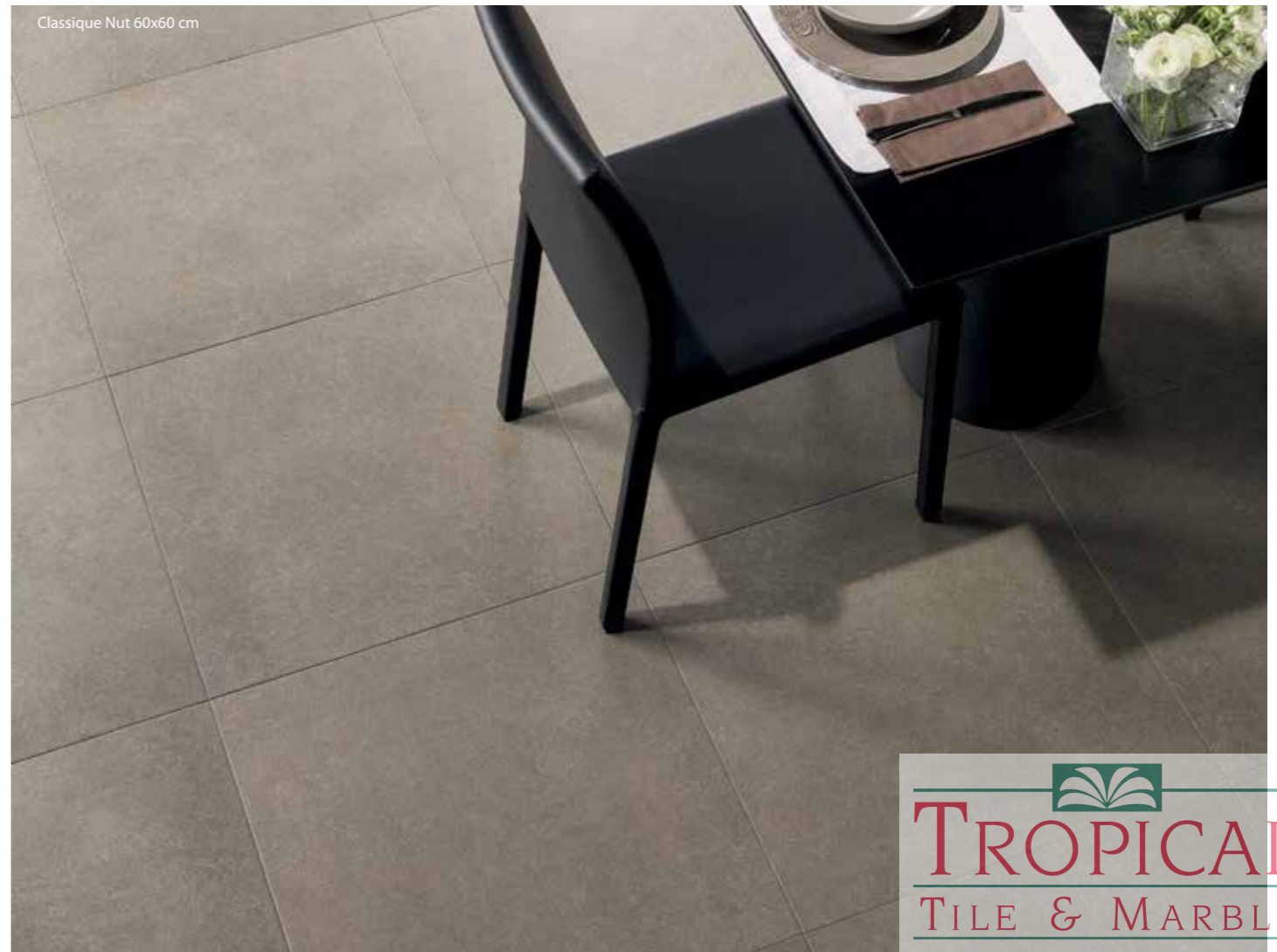
Classique Nut 60x60 cm