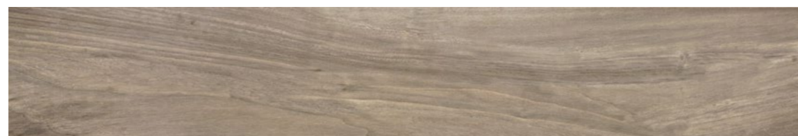
G0009A TABULA XL CENERE 20x120 - 7,9"x47,2"