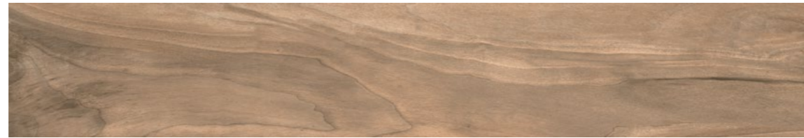
G0010A TABULA XL NOCE 20x120 - 7,9"x47,2"