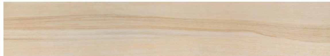
G0012A TABULA XL MIELE 20x120 - 7,9"x47,2"