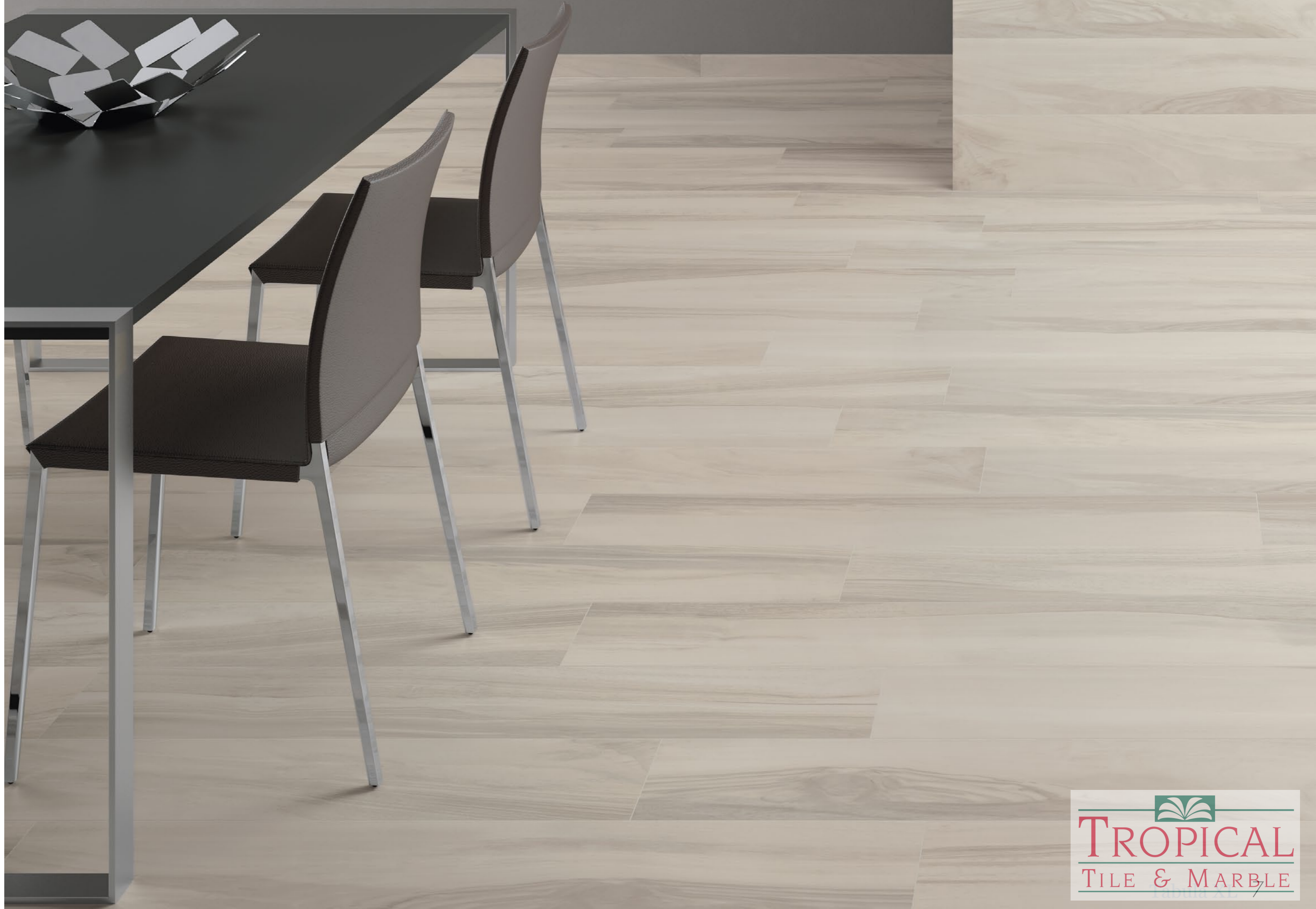
Tabula XL Bianco 20x120 - 7,9"x47,2"