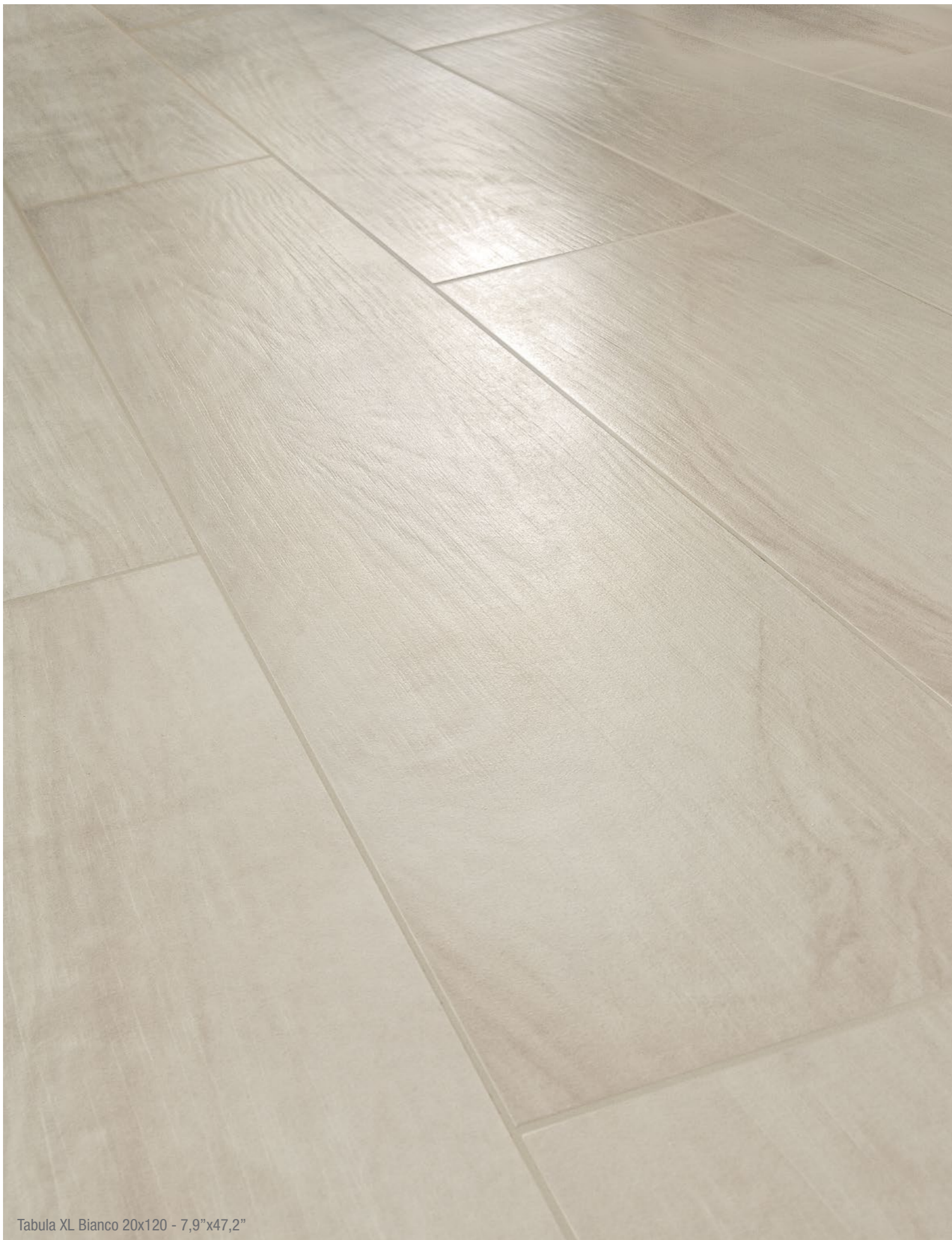
Tabula XL Bianco 20x120 - 7,9"x47,2"