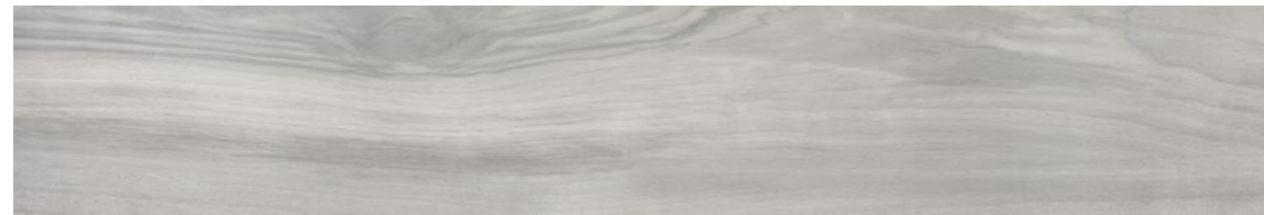
G0011A TABULA XL GRIGIO 20x120 - 7,9"x47,2"