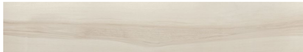
G0008A TABULA XL BIANCO 20x120 - 7,9"x47,2"